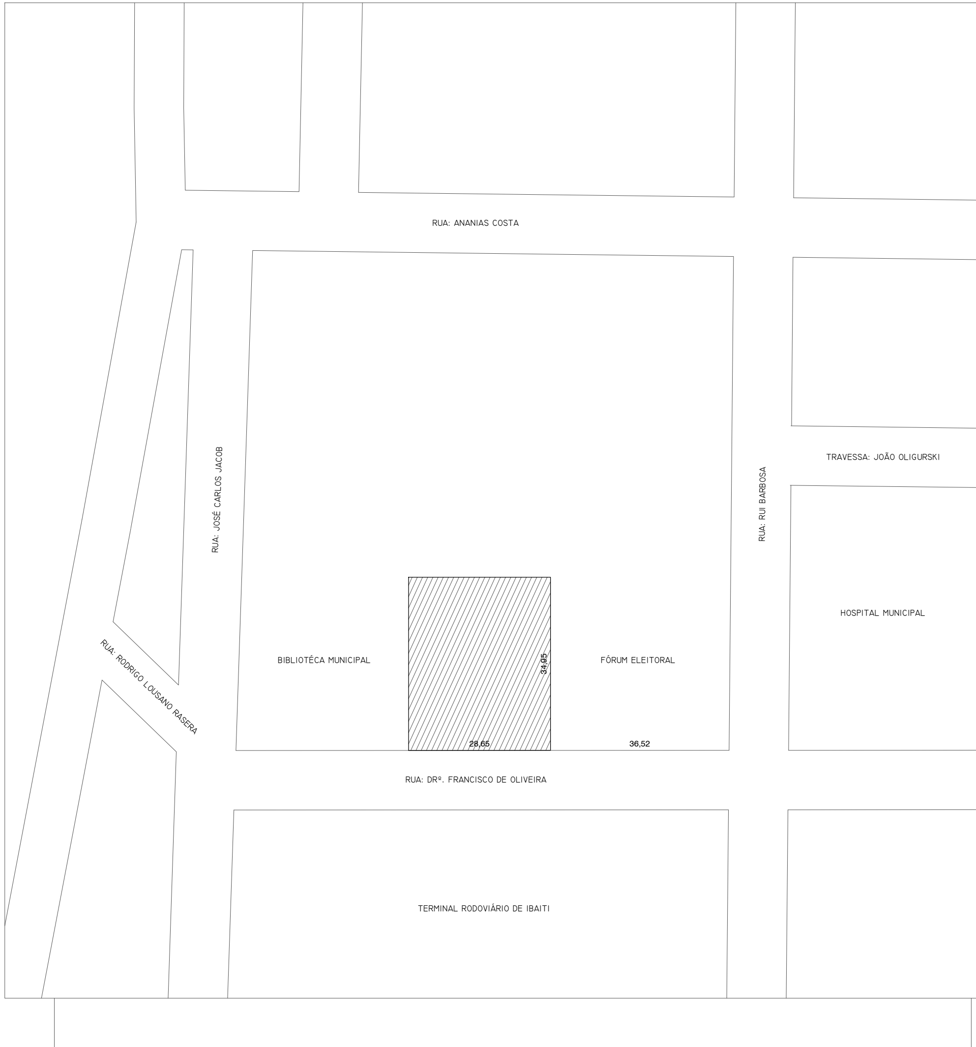
SITUAÇÃO ESCALA: 1:100